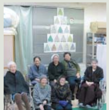
ぬり絵は、脳を活性化させるのです！