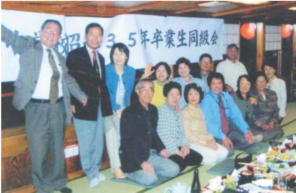
昭和35年卒業同級会 (H17.4.11)

最後に私は檜枝岐村で育ち、多くの山を歩き、自然の厳しさ、風になびく優しさを学びました。特に会津駒ヶ岳の積雪にも負けない榎松、燧ヶ岳の風雪に耐えるハイ松、屏風岩の風になびき風情あふれる松、ブナ平の優しく繊細なもみじ等、自然の厳しさ、優雅さを盆器に表現する、さつき盆栽を一生の友として楽しみ、全国展示会に入賞できるような作品を作ることを目標に、常に自然の美しい檜枝岐村に思いを馳せながら、四季折々の盆栽を楽しんでおります。