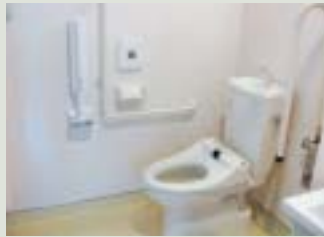
ゆったり広々トイレ