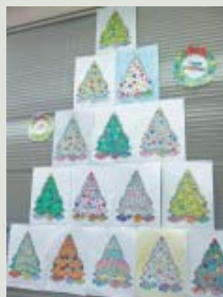
色とりどりの、個性的なツリー達

今年のクリスマスツリーはそれぞれが好きな色を塗ったクリスマスツリーを合わせて作成しました。同じ絵でも、配色や塗り方でまるで違う絵のよう。塗り絵は、個性がキラリと光って、おもしろいのです。