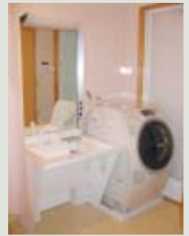
お年寄りの自立を支援するための浴室 車いすでも使いやすい洗面台